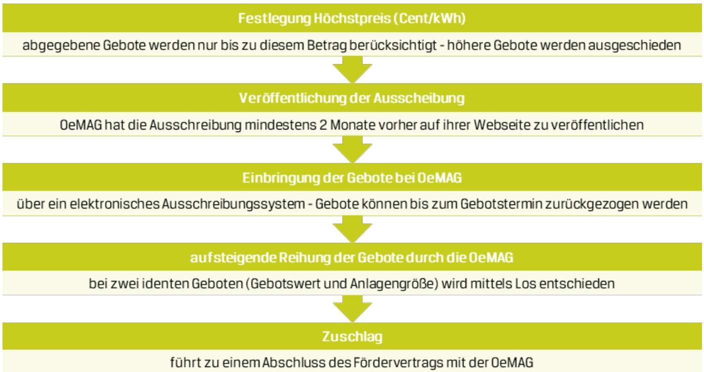
Abbildung 2: Beschreibung der Ausschreibung